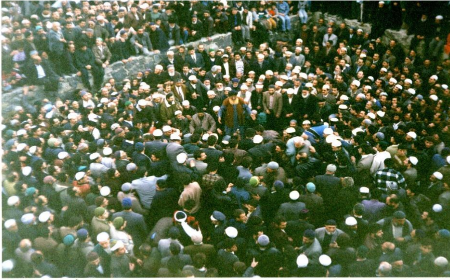
Mevlud Baba -Son Yolculuk