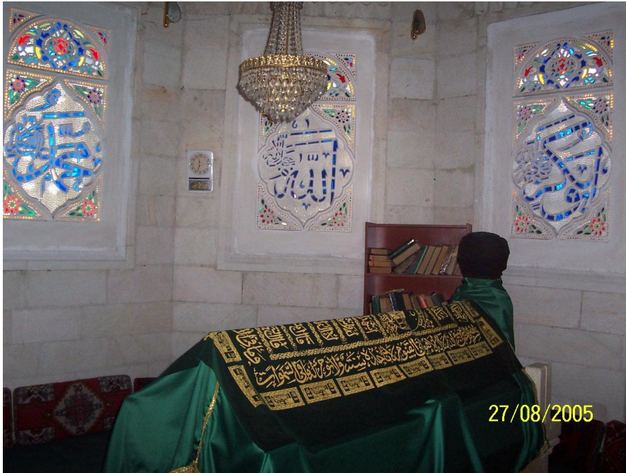
Mevlud Baba'nun türbesinin iç görünümü